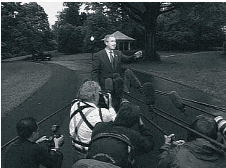
Rysunek 7.1. George W. Bush na zwołanej przez siebie konferencji prasowej

W odpowiedzi na pytanie dziennikarza o szanse na reelekcję, Bush stwierdził: