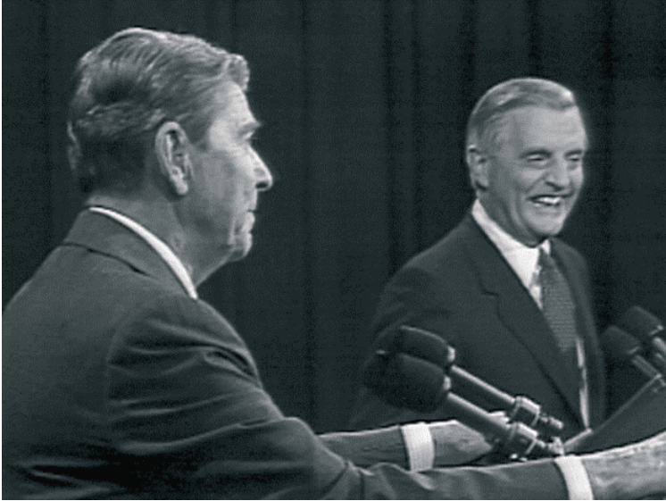
Rysunek 7.3. Ronald Reagan wykonuje mistrzowskie ścięcie w stronę Waltera Mondale'a

Nawet jego przeciwnik, senator Mondale, zrozumiał, że stoi przed prawdziwym mistrzem tej gry i wybuchnął śmiechem razem ze wszystkimi na widowni (rysunek 7.3).